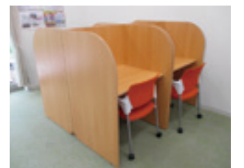
多目的個別ブース及びイス

【企業版ふるさと納税詳細】 https://www.city.maebashi.gunma.jp/soshiki/seisaku/seisakuishin/gyomu/2_1/2997.html