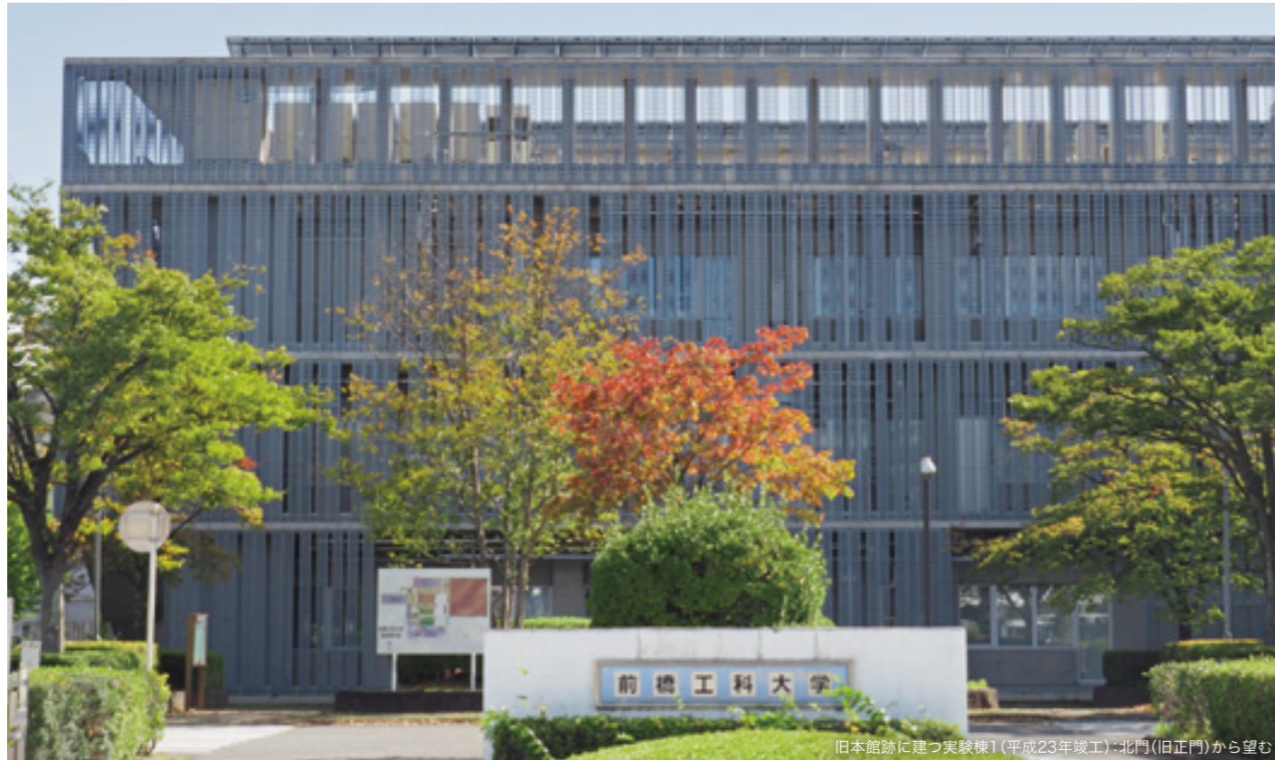
旧本館跡に建つ実験棟1(平成23年竣工)・北門(旧正門)から望む

編集・発行 前橋工科大学同窓会事務局 発行責任者 前橋工科大学同窓会長 金井 喜一 事務局 〒371-0816 群馬県前橋市上佐鳥町460-1 TEL.027-265-7361 FAX.027-265-3837 E-mail: dousoukai@maebashi-it.ac.jp 同窓会HP: https://www.maebashi-it.ac.jp/dousoukai/