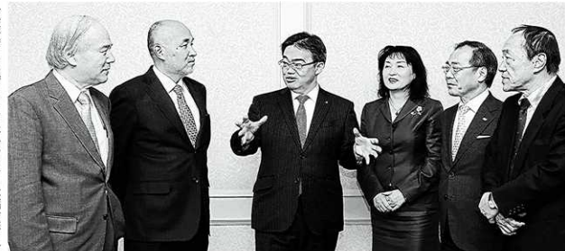
座談会に出席した(左から)豊橋技術科学大の大西隆学長、名古屋工業大の鶴岡裕之学長、愛知県の犬村秀章知事、愛知教育大の後藤ひとみ学長、名古屋大の松尾清一学長、中日新聞社の河津市三常務