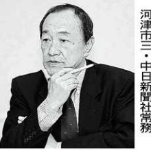
河津市三・中日新聞社常務

愛知といえはものづくりです。ロボット工学が進めば、いろいろ便利になるかもしれませんが、でも、つくっているのは人です。独自の発想や教育、理科に興味を持つ子どもを育てるのは、社会貢献の志をしっかりと持っていることが大切です。専門分野の高度な知識や技術に加え、基本的教養を備えなければなりません。コミュニケーション能力も非常に重要になってきました。こういう能力を持った人をどのように育てるかを基本と考えています。これらのことは、国際標準の大学教育を提供することにつながります。本学が提供している一万科目の講義のうち、千二百は英語による講義で、既に全体の12%を完全に英語化しています。その他、海外の大学と共同学位を取得する態勢を整えることで、名大の学位が国際的に通用すると示すことができます。日本では子どもがどんどん減っています。「国立大はこんなに多く必要ない」となる、外国から優秀な若者を入れる必要があると思います。そのための環境を整えないといけません。現在、名大には世界九十七カ国から三千人を超える留学生が来ています。全学生一万六千人のうち、10%以上が留学生。中国が最も多く九百人で、韓国が二百人です。最近増えているのがインドネシア、ベトナムです。7.5%で少ないが、ヨーロッパからも増えています。いろんな国の人が集まることで、日本の学生も刺激を受けます。